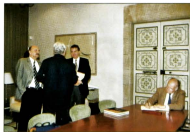
Roald Hoffmann signa el llibre d'honor de l'IEC.